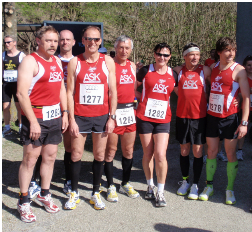
vor dem Start beim Ingolstädter Halbmarathon